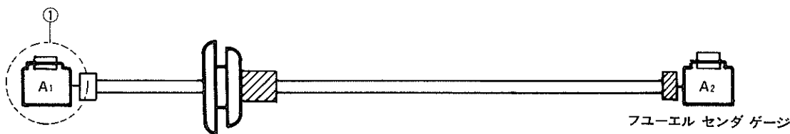
図4-1 ワイヤ, フューエル ゲージ (バン)