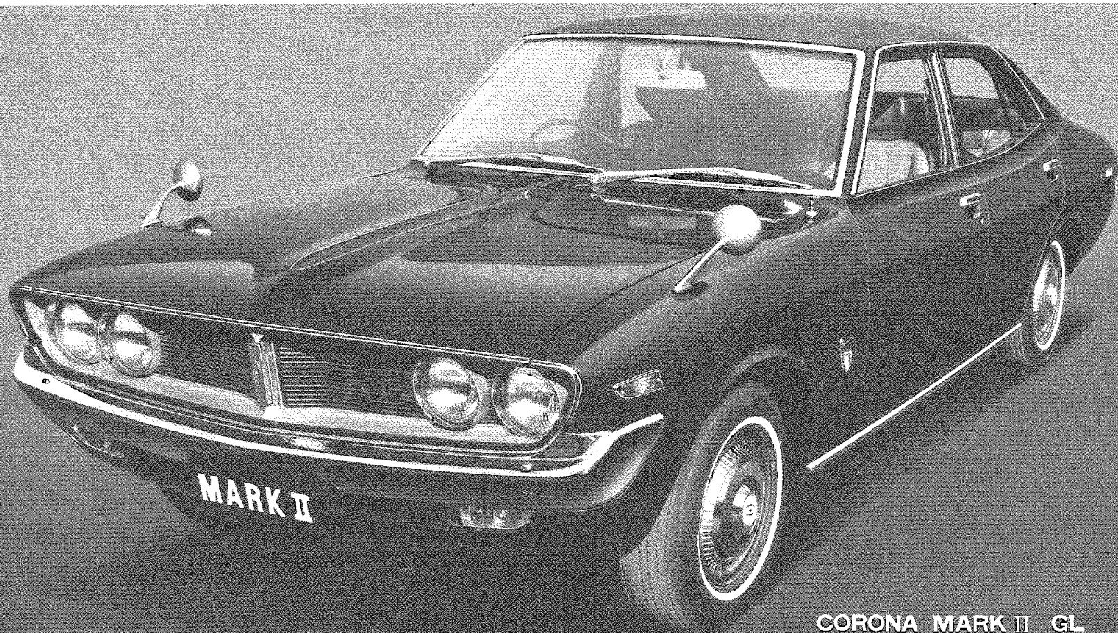
CORONA MARK II GL

ください。また、本書は、GL車を基本に編集してあります。GL車以外の取り扱いについてはGL車と異なる点のみ説明してあります。