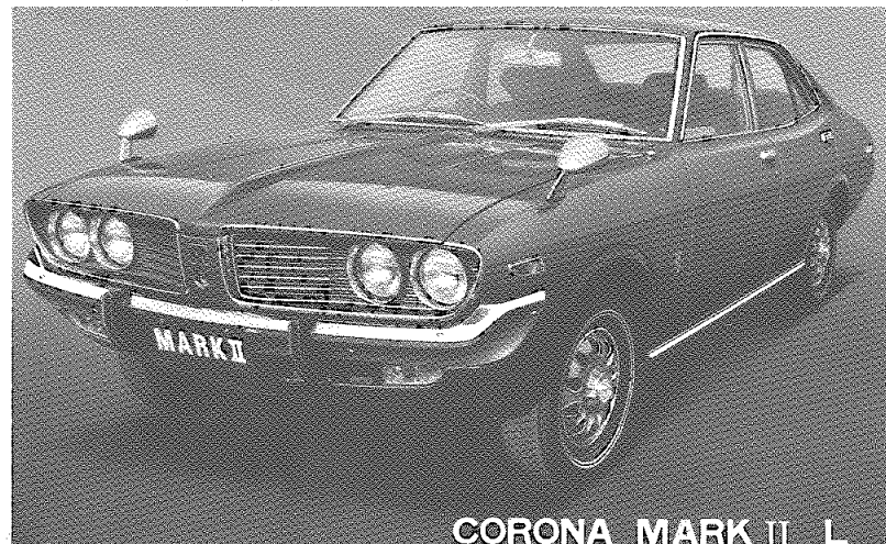
CORONA MARK II L