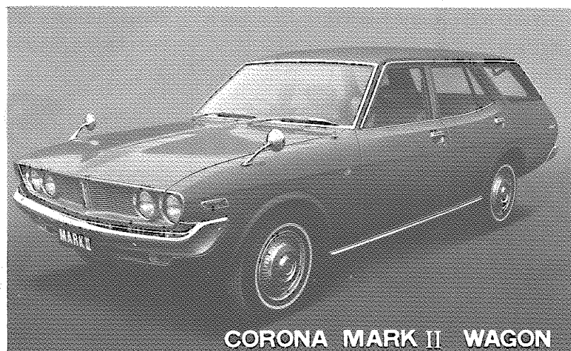
CORONA MARK II WAGON

車両の仕様、その他の変更により本書の内容が車両と一致しない場合がありますので、あらかじめご了承ください。