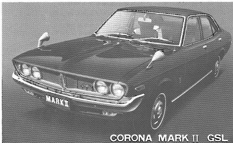
CORONA MARK II GSL