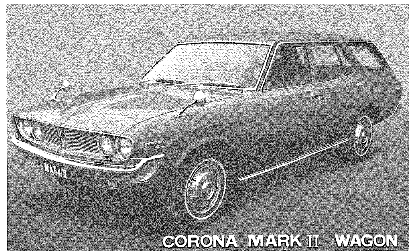
CORONA MARK II WAGON

車両の仕様、その他の変更により本書の内容が車両と一致しない場合がありますので、あらかじめご了承ください。