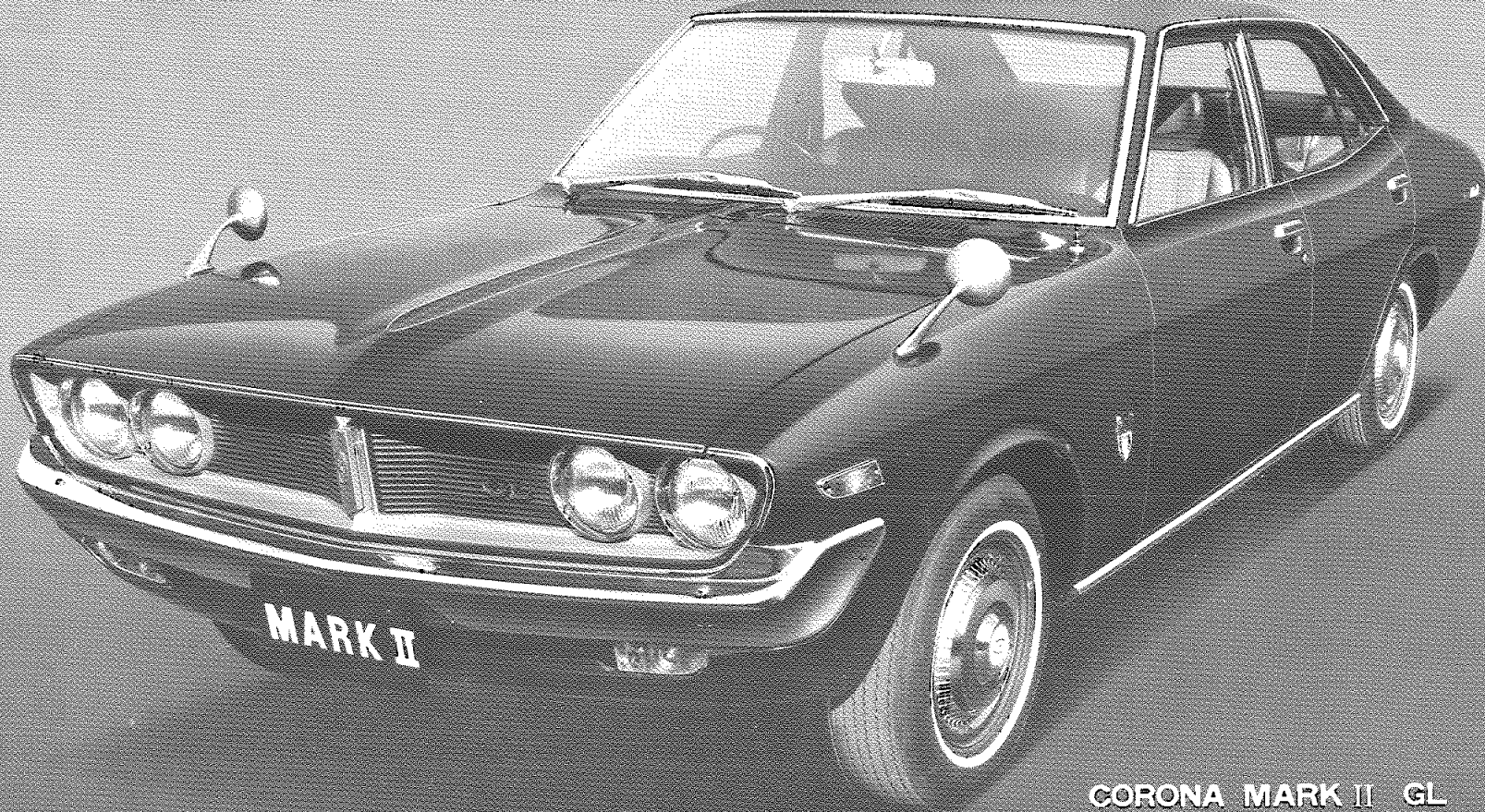
CORONA MARK II GL

ください。また、本書は、GL車を基本に編集し てあります。GL車以外の取り扱いについてはG L車と異なる点のみ説明してあります。