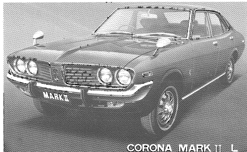
CORONA MARK II L