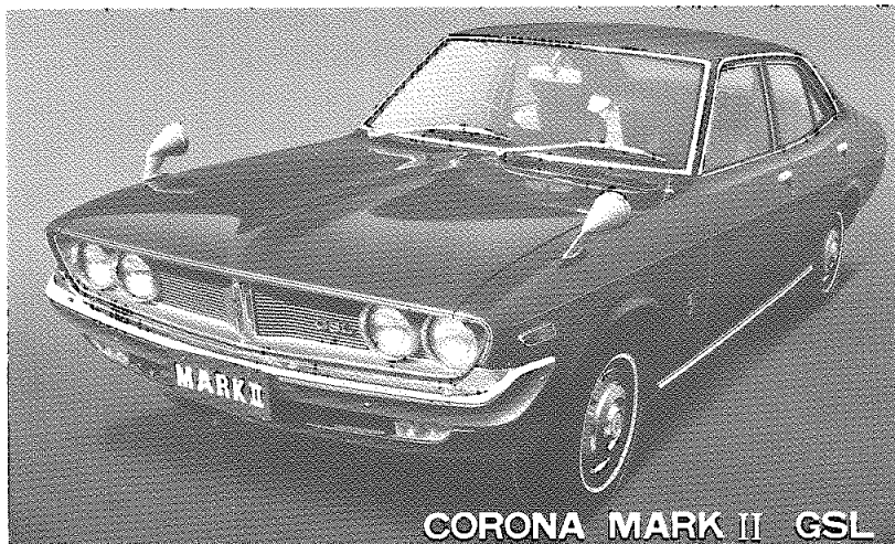
CORONA MARK II GSL