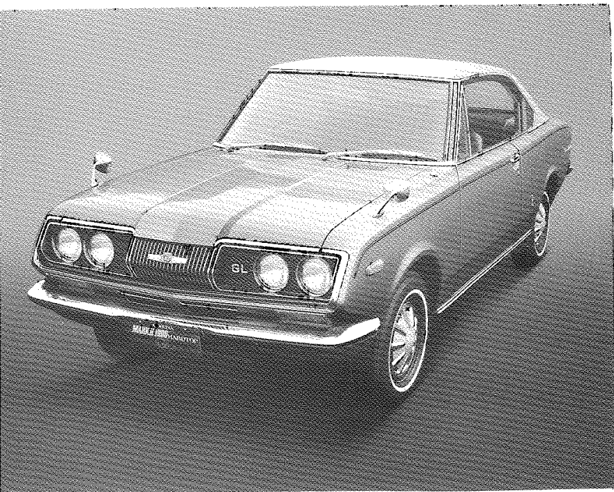
CORONA MARK II 1900 GL