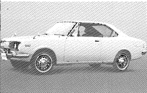
CORONA MARK II 1700 HARDTOP