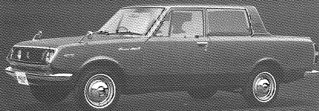
CORONA MARK II PICK-UP