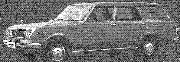
CORONA MARK II 1700 VAN