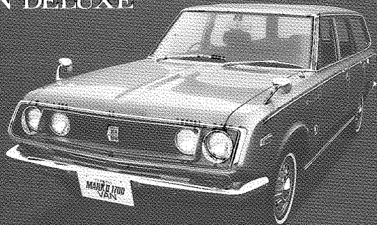
CORONA MARK II 1700 VAN DELUXE