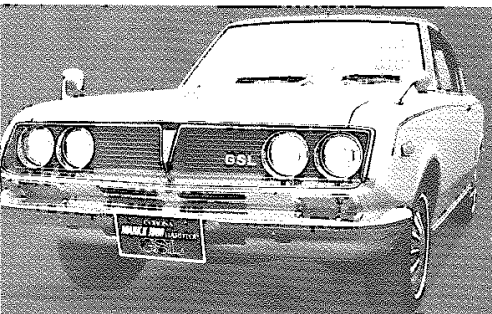
CORONA MARK II 1900 HARDTOP GSL