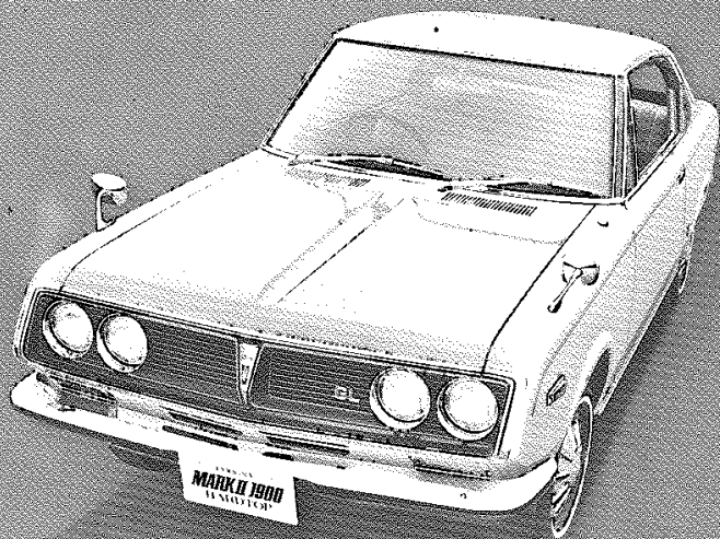
CORONA MARK II 1900 GL