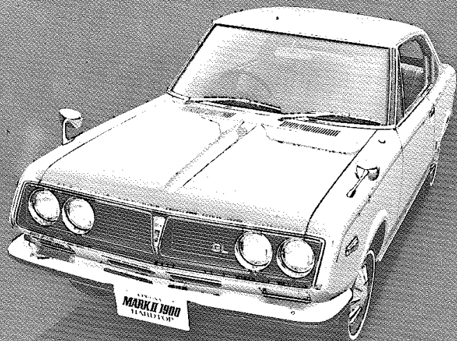
CORONA MARK II 1900 GL